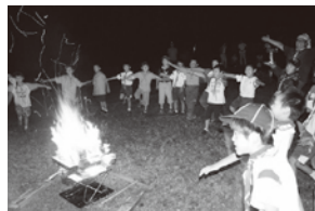
▲キャンプファイヤー